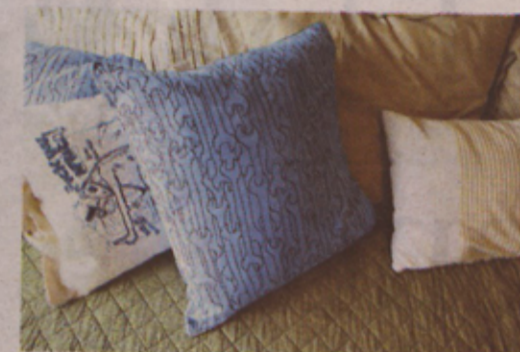
Han er en «handy man», og han syr sine redskaper.