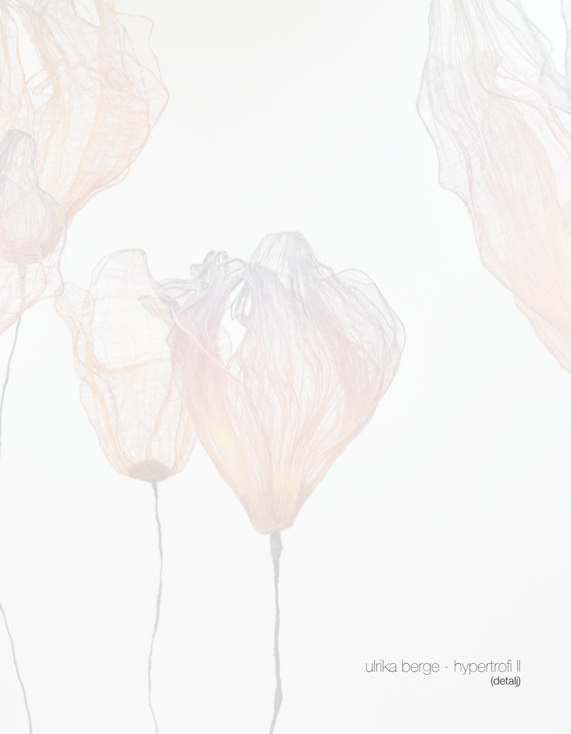
ulrika berge - hypertrofi II (detail)