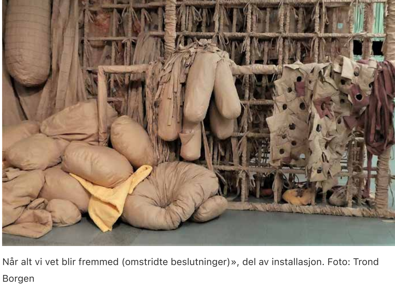
Når alt vi vet blir fremmed (omstridte beslutninger)», del av installasjon.