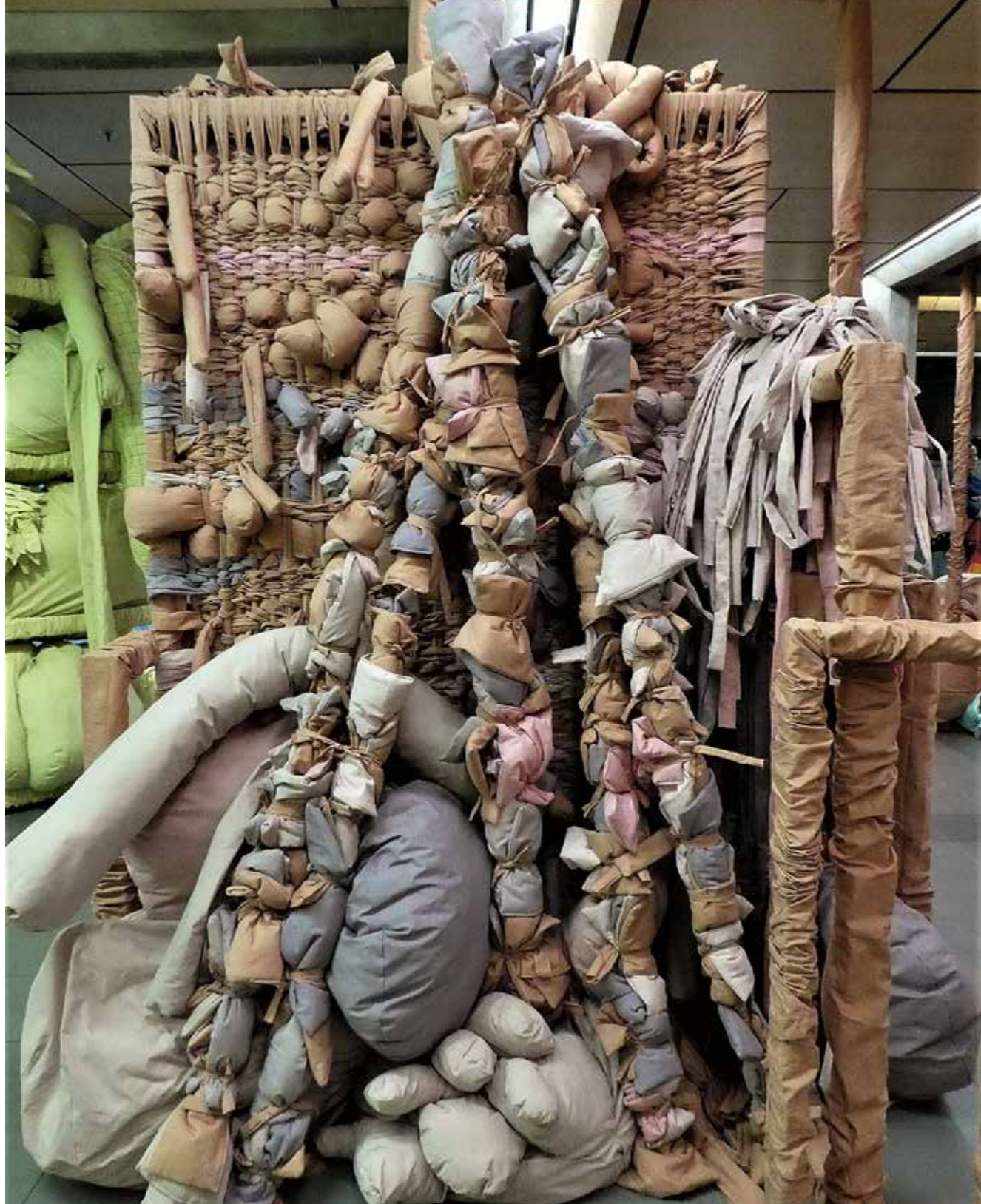
En detalj fra installasjonen «Når alt vi vet blir fremmed (omstridte beslutninger)».

På ett plan dreier det seg om å gjøre harde byggeplasser myke. Raustein er åpenbart inspirert av rør, stillaser, planker og diverse filler brukt til å beskytte bygningsinstallasjoner, noe han viser i katalogens sidestilling av fotografier fra slike plasser med bilder fra hans egen kunst. Når han gjenskaper og forvandler slike steder i sin installasjon, er grunnstrukturen et bærende system av nettopp rør, planker og hyller, og på disse dels stapper han inn, dels henger han utenpå, remser av tøy, draperier, svulmende tekstilformer som buler, tyter og strutter ut i rommet. Jeg går inn i et mykt fantasilandskap med fire ulike stasjoner, hver farget med én farge.